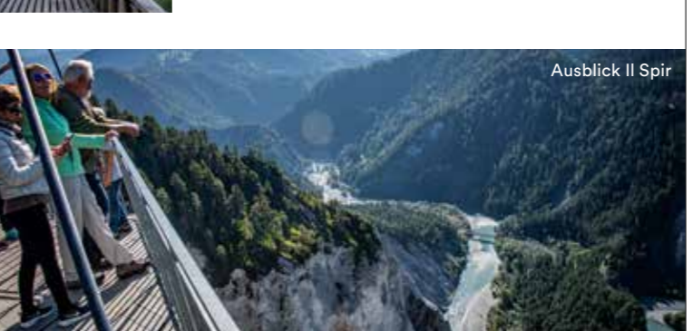
Ausblick Il Spir

Wackenaus Die Aussichtsplattform «Wackenaus» liegt am Ende der massiven Rheinschlucht und ist von Trin Bahnhof über die Wanderroute 656.4 oder von Bonaduz über die Route 656.7 gut zugänglich.