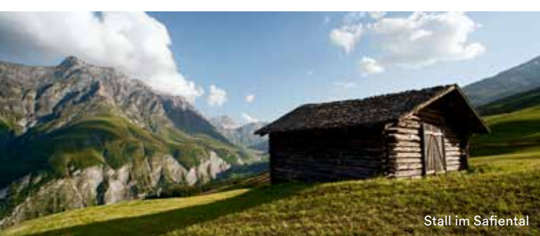
Stall im Safiental