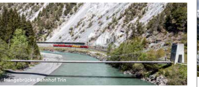
Hängebrücke Bahnhof Trin

Die Holzhangbrücke in Trin ist eine von drei Übergängen in der Rheinschlucht. Mit einer Länge von 105 Meter und einer Gebreite von 1.8 Meter gehört sie zu den längsten in Graubünden.