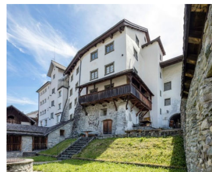
Museum Regional Ilanz