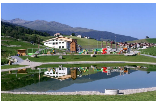
Rufalipark Misanenga Badesee